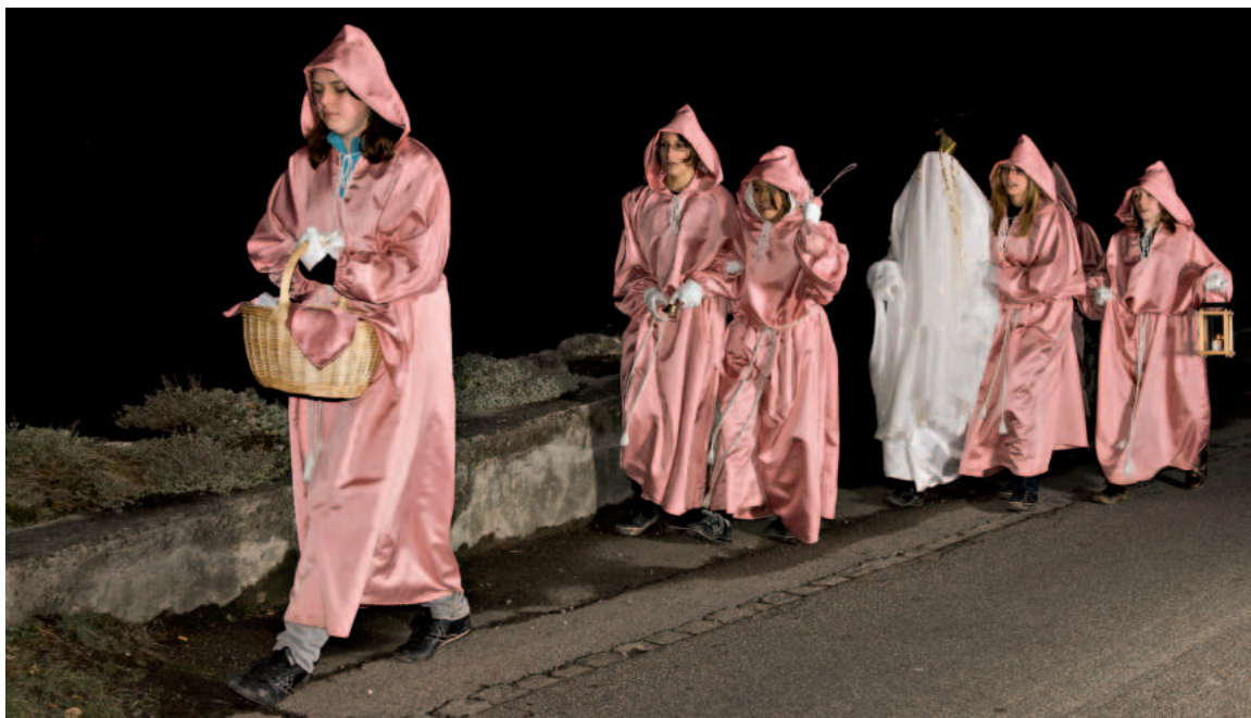
Langer Marsch: Das Wiehnechts-Chindli und seine singenden Begleiterinnen besuchen an zwei Abenden alle Haushalte im Dorf.