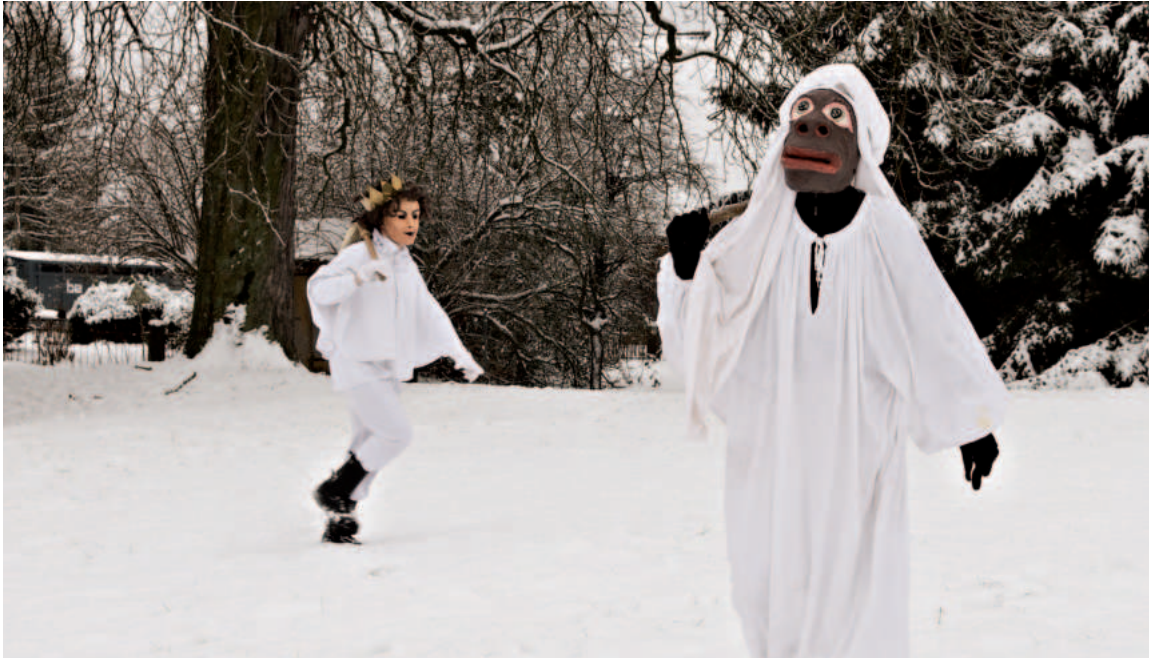
Auf der Jagd durchs Schneefeld: Dem Herr und dem Kameltreiber ist scheinbar kein Weg zu weit.