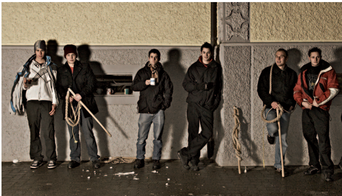
Letzte Gelegenheit zum Chlöpfen im alten Jahr: Chlauschlöpfer-Gruppe am Chlausjage erholt sich.