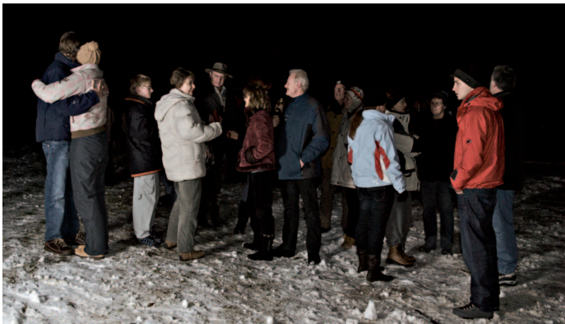
Fernab von Raketen und Tischbomben, ziehen die Haubuer auf dem Bruderhübel einen rubigeren Silvester in der Dorfgemeinschaft vor.