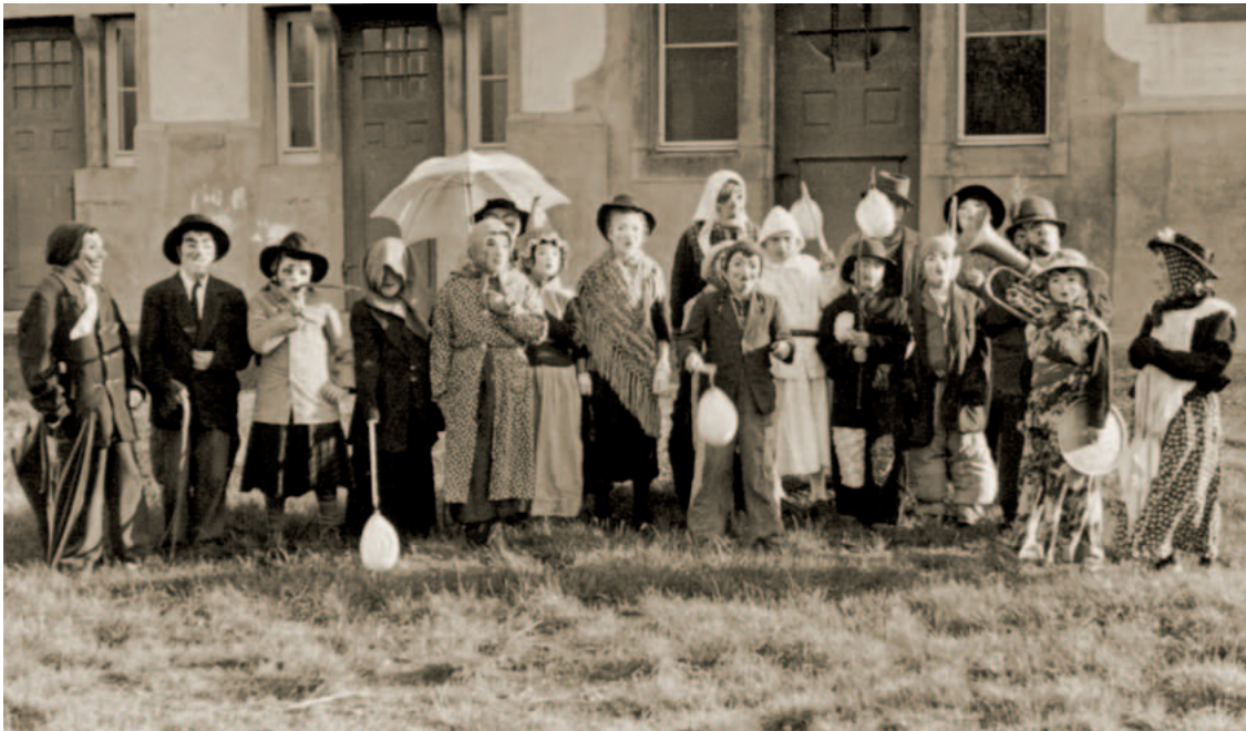
Die Kleinen Bärzeli, 1949: «Sie tragen an Stöcken aufgeblasene Schweinsblasen und schlagen damit wahllos drein, besonders auf flüchtende Mädchen.» (Dorfchronik)

der Bärzeli . Weitere, detaillierte Aufzeichnungen aller Bräuche sind der Dorfchronik von 1931 zu entnehmen.