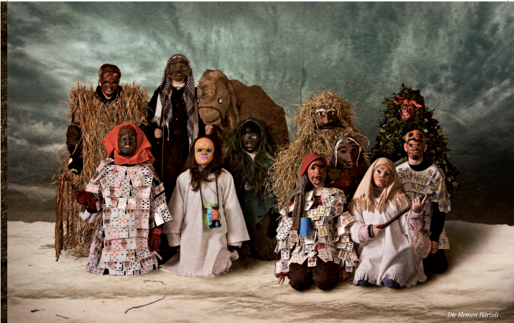
Die Kleinen Bärzeli