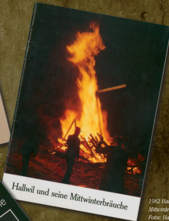
1982 Hallwil und seine Mittwinterbräuche