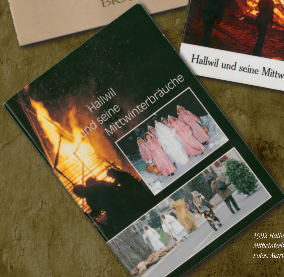
1992 Hallwil und seine Mittwinterbräuche