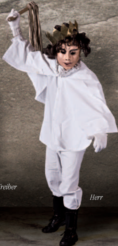
Kamel mit Treiber und Führer