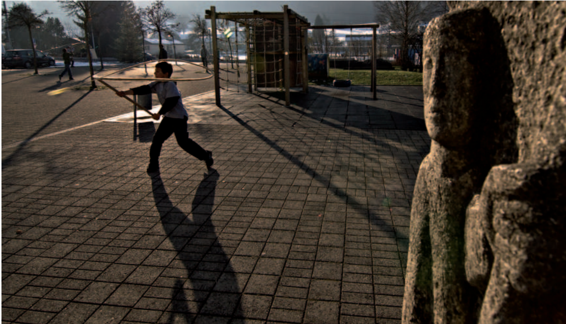
Früh übt sich: Ein junger Chlauschöpfer auf dem Hallwiler Schulhausplatz nutzt die Gunst der Stunde beim Übungschlöpfen.